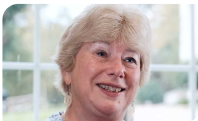
Λιν.Ασθενής ,Ηνωμένο Βασίλειο

"Πραγματικά βοηθά να ξέρεις ότι και άλλοι άνθρωποι μπορούν να το περάσουν."