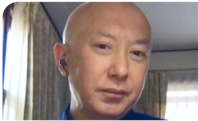
Χίρο. Ασθενής απο Ιαπωνία

" Πραγματικά συστήνω να συμμετέχεις σε μια ομάδα στήριξης"