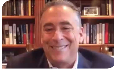
जोल, रोगी, युएसए

"फेसबुक के इस समुदाय के साथ हम ज्यादा खुलकर बातें कर सकते हैं"