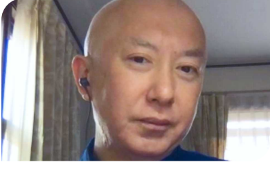
हिरो | रोगी, जापान |

"मैं बड़ी ज़िम्मेदारी से एक रोगी समर्थन ग्रुप से जुड़ने की सलाह देता हूँ |"